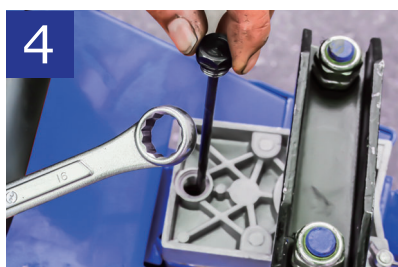
4 16 mmスパナまたは6 mm六角棒レンチを使ってオイル注入口を開けます