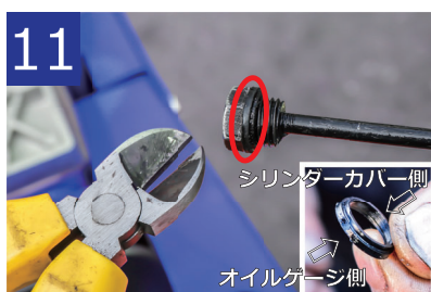
11 Oリングを交換します。古くなるとオイル漏れの原因となります