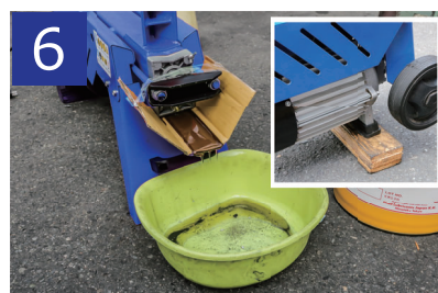
6 オイルが出やすくなる様にモーターの下に木を入れ、バケツに移します