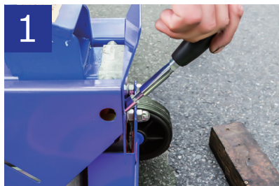
1 操作レバーを反時計回りに回し、取り外します