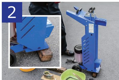
2 操作レバー側を下にして薪割機を立たせます