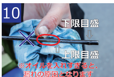
10 オイル量を再度確認し、上限目盛より3cmほど多くなるよう調整します