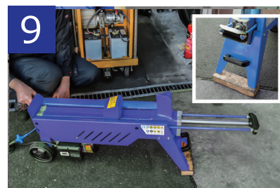
9 割り刃側の足の下に木を入れて10回程試運転をします