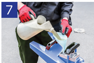
7 薪割機を立たせ3 l分のオイルを注入します。