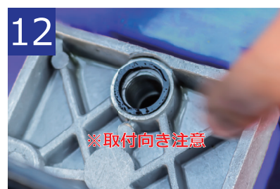
12 Oリングは、向きに注意ししっかりと締めてください以上でオイル交換完了です