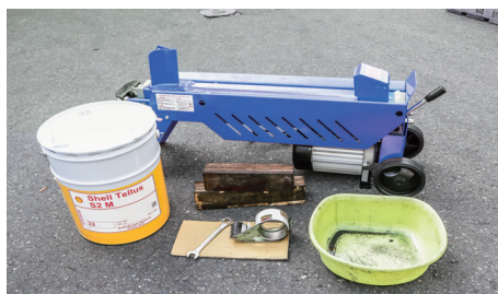
※画像は KT-155PRO-DX です