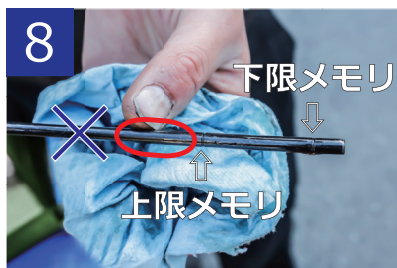
8 オイルの量を確認し、上限メモリより3 cm程多く入れてください